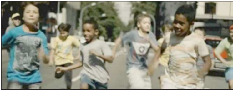
Figura 7 - Criança e diversidade – Comercial Fiat “Vem pra rua”

A voz em off finaliza o comercial, com o reforço da legenda: “Vem com quem mais entende de rua, vem com a Fiat”. Este comercial que foi veiculado no período da Copa das Confederações de futebol, sediada no Brasil, onde aconteceram manifestações pelo país, com o mote “vem pra rua” 151 , também exemplifica a rápida participação de mulheres negras em meio à “multidão brasileira”. As imagens, que expressam a diversidade de pessoas que assistem ao jogo de futebol