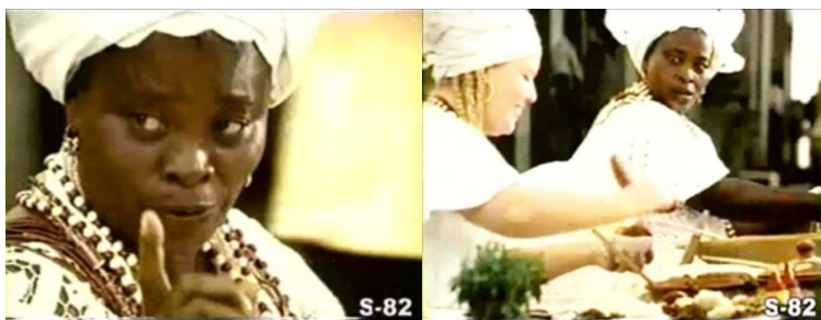
Figura 19 - “Vou te ensinar a fazer acarajé, viu filha?” Figura 20 - Alemanha e Brasil: salsicha no acarajé

Já na campanha do Gol, da Volkswagen, de 1999, embora a mulher negra em evidência seja uma das protagonistas, representando uma profissional – baiana de acarajé – o enredo tem como objetivo fazer um comparativo entre o Brasil e a Alemanha e, para isto, utiliza diferentes iguarias como símbolos culturais da gastronomia destes países. Em um diálogo entre duas mulheres vestidas de baiana, a mulher negra, que tem sotaque da Bahia, ensina a mulher branca, que representa uma alemã, a fazer um acarajé: “Eu vou te ensinar a fazer acarajé, viu filha? Bote o acarajé, põe o vatapá, camarão...” (Figura 19). A narrativa pretende mostrar a falta de conhecimento e habilidade da “baiana” estrangeira em fazer um acarajé com salsicha e mostarda... (Figura 20).