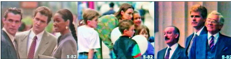
Figuras 16, 17 e 18 - Todos(as) contemplam a chegada da linha de carros Renault no Brasil

Também observei propagandas em que a mulher negra está representada como profissional (o que é observado pelo vestuário, posição e contexto), mas que, também, quando assumiu este papel, a alusão ao Brasil se manteve presente. É o caso da propaganda da marca Renault, de 1992, que anuncia a chegada da sua linha de carros (vários modelos e tipos) buscando afirmar a sua posição no país, uma vez que a fábrica só iniciou as suas atividades no Brasil em 1998. Com música