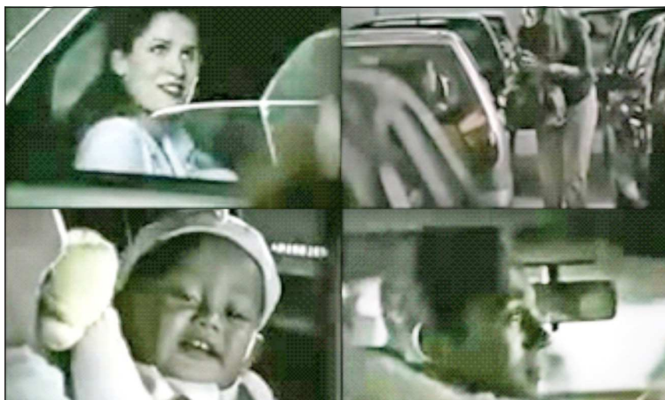
Figura 24 - “Tá de motorista... virou madame!”, Figura 25 - Mãe, Figura 26 - Bebê e Figura 27 - Pai

Sendo o estereótipo uma das maneiras como grupos sociais são descritos em uma cultura, de modo fixo, preconcebido, simplificado, imprimindo a generalização e a homogeneização das(os) sujeitas(os), nestas propagandas, a intenção é chamar atenção