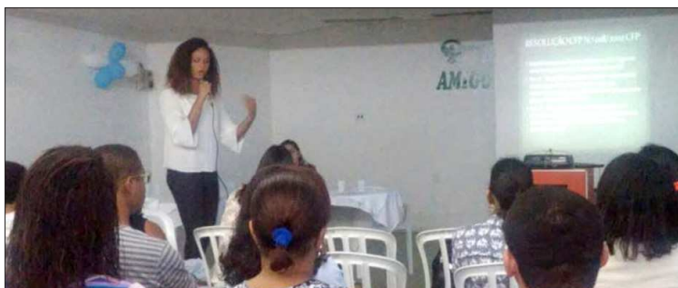
Semana de Psicologia da Faculdade Unime. Mesa Redonda "Psicologia, saúde mental e relações raciais: construções de práxis" (Salvador).