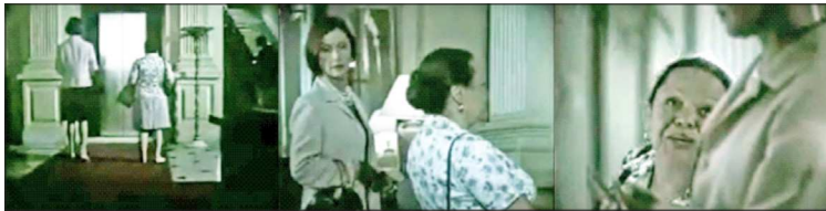
Figura 21 - À espera do elevador, Figura 22 - “O elevador de serviço é para lá” e Figura 23 - “Comprei a cobertura...”

Em uma delas, a cena inicial exhibe duas mulheres – uma branca e outra parda – lado a lado, em um ambiente que sugere um hall de entrada de um prédio “nobre”, aguardando o elevador social (Figura 21). A mulher adulta branca (à esquerda na imagem) sugere, a partir da leitura do senso comum, uma senhora rica, da alta