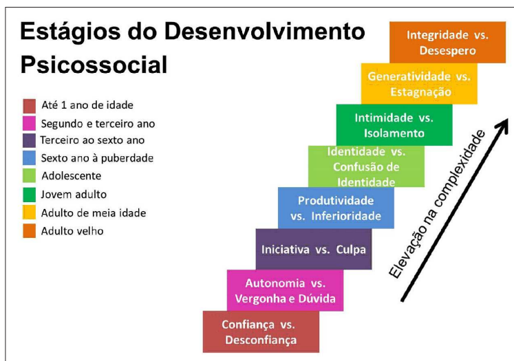
Figura 1: Modelo de Erikson.

Destacam-se, de acordo com Tania Zittoun et. al. (2013), duas tentativas para identificar processos de desenvolvimento no curso da vida: o modelo proposto por Erik Erikson 89 focaliza o desenvolvimento da identidade; “a Psicologia do life-span” formulada por Paul Baltes 90 . Na primeira tentativa, o interesse era pela “unidade do ciclo da vida humana”, mas Erikson se propôs a examinar as dinâmicas específicas de cada uma de suas etapas, conforme prescrito pelos pressupostos do desenvolvimento individual e da organização social. Os processos descritos por Erikson são dinâmicos por natureza e consideram a(o) indivíduo(o) na sua necessidade de continuidade e uniformidade, sendo submetida(o) às mudanças de seu organismo e às demandas específicas de seu ambiente social e histórico. Apesar disso, ele propôs um modelo de curso da vida organizado em oito etapas e representado em uma escada (Tania ZITTOUN et. al., 2013), conforme exemplificado pela figura 01.