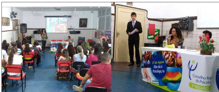
Semana de Psicologia do Iperba (Salvador)

Semana de Psicologia do CRP-03. "Psicologia e Diversidade Sexual: uma Reflexão sobre questões de Gênero e Cidadania" (Feira de Santana)