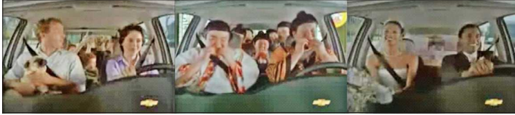
Figura 13 - Família branca, Figura 14 - Família nipônica e Figura 15 - Casal negro

da banda brasileira Titãs – tomada como inspiração, que aglomera não só mães/pais e filhas(os), mas parentes como tia, avó, etc. – embala o comercial com as cenas que contemplam famílias 153 : mulher e homem brancos, filhas(os) e cachorros (Figura 13), família de nipônicos (Figura 14), além das(os) recém-casadas(os), ambas(os) negras(os), ainda vestidas(os) de noivas(os) (Figura 15), entre outras. A voz em off reforça a intenção do comercial do Monovolume e para quem se dirige: “Chevrolet Zafira 2004, a única da categoria com sete lugares, cabe tudo, cabem todos”.