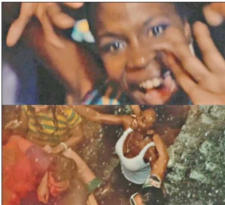
Figuras 9 e 10 - Fiat Institucional 2013 – Vem para rua – Mulheres negras na multidão brasileira, comemoração da copa das confederações de futebol no Brasil

pela TV, crianças de diferentes raças/etnias correndo nas ruas (Figura 7), multidão nas avenidas junto aos carros e grandes bandeiras (Figura 8), torcedoras(es) de idades diferentes vestidas com cores da bandeira nacional comemorando, dançando, pulando molhadas(os), em clima de festa (Figuras 9 e 10), conjugam com a letra da música neste comercial.