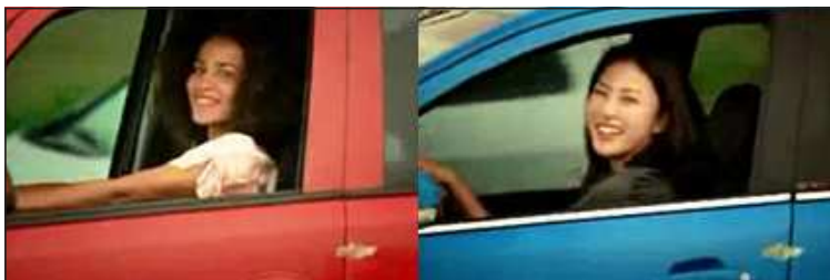
Figuras 1 e 2 - Mulher negra e mulher asiática dirigem automóveis: foco na diversidade do público brasileiro

A fala em off que finaliza o comercial reforça que o carro é para as(os) brasileiras(os): “Fiat Palio, criado para as pessoas mais importantes do Brasil, gente assim, como você”.