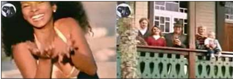
Figuras 5 e 6 - “Lá vai o Brasil, subindo a ladeira...” Mulher negra “joga beijos” ao som de samba e cenário do Rio de Janeiro. Família com fenótipo europeu contempla o automóvel passar.

Com formato semelhante, a propaganda do Fiat Uno EP, de 1996, se inicia dando ênfase à potência do motor deste modelo, que ficou mais power (poderoso). A música “Lá vai o Brasil descendo a ladeira” 147 , de Moraes Moreira, foi a base/inspiração para acompanhar a narrativa, no entanto, no refrão cantado na propaganda, a palavra “descendo”, da música original é substituída por “subindo”, para dar destaque à potência do motor. Assim, usando como frase-refrão “Lá vai o Brasil, subindo a ladeira”, com a melodia do samba, da música original, a propaganda projeta para o(a) telespectador(a) “o que é o Brasil”. Descrevendo os cenários, é possível perceber que a publicidade deve estar baseada na música: cenas do veículo em caminhos íngremes, circulando em cenários que remetem a cidades brasileiras e com público heterogêneo – classe, cor, idade – compondo as imagens. Uma mulher branca, da varanda de casa, contempla o Uno passar, um homem adulto branco com roupa executiva caminha na rua e olha para o veículo, uma mulher adulta jovem negra “joga beijos” para a câmera com cenário do Rio de Janeiro ao fundo (Figura 5), uma mulher adulta jovem loira em ambiente de