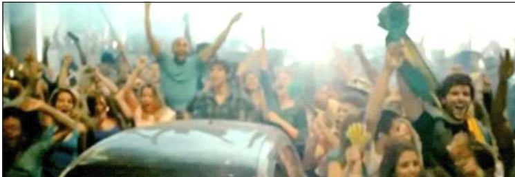
Figura 8 - Brasileiras(os) – Comercial Fiat “Vem pra rua”