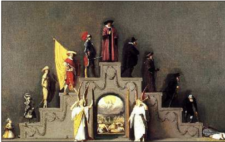
Figura 3: Representação protótipo de curso de vida na Europa

propagandas normativas do curso da vida que orientam a conduta de pessoas de diferentes idades, chegando-se ao destino final através de um progresso ordenado pelos estágios apropriados do curso da vida humana (Tania ZITTOUN et. al., 2013).