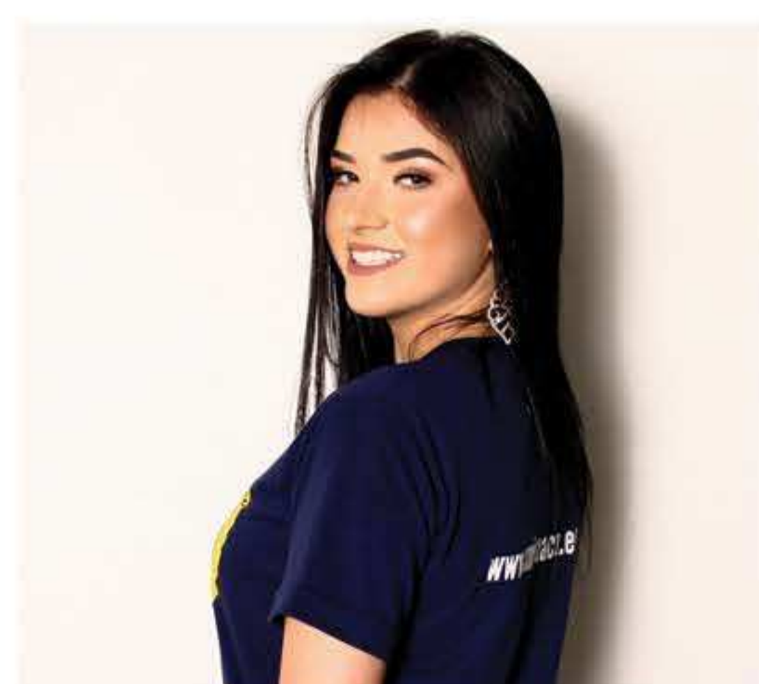
Daniele Osório Fisioterapia