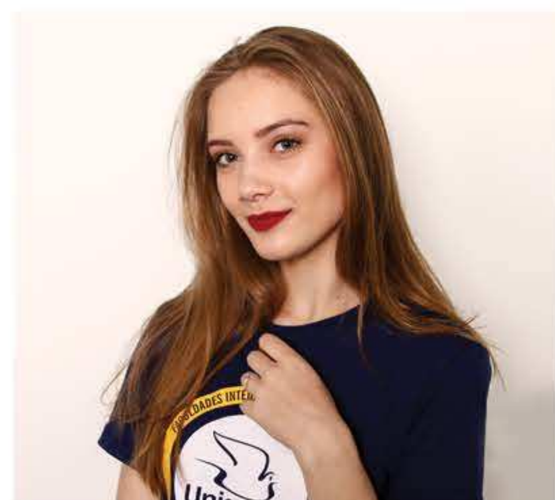
Luyze Stella Rech Psicologia