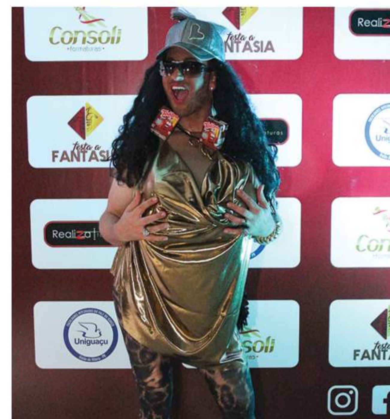
Kau Giacobbo (1 Kit Multimídia Subwoofer 2.1 Sate)