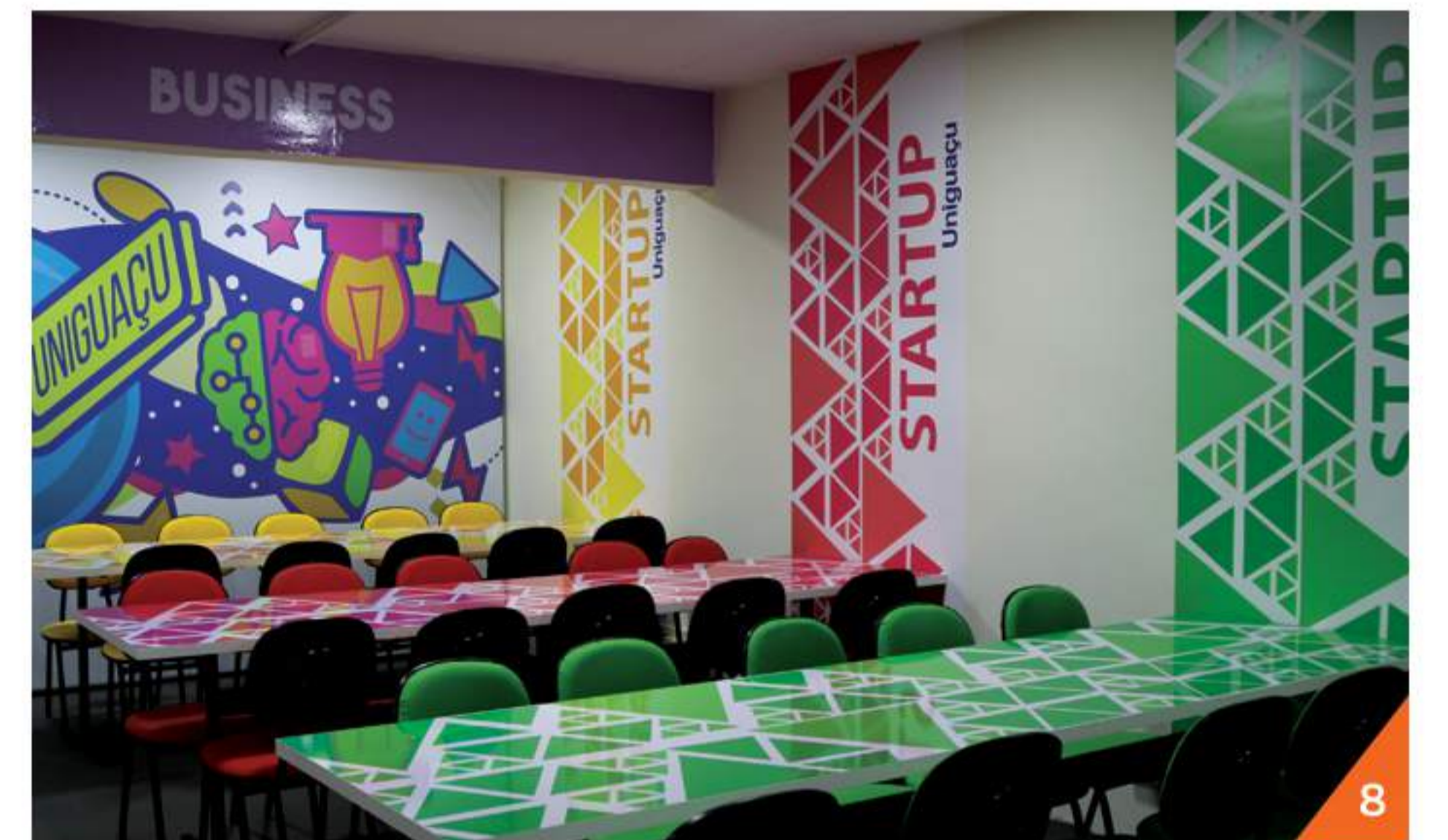
Tem início Startup Garage Uniguaçu em parceria com o Sebrae