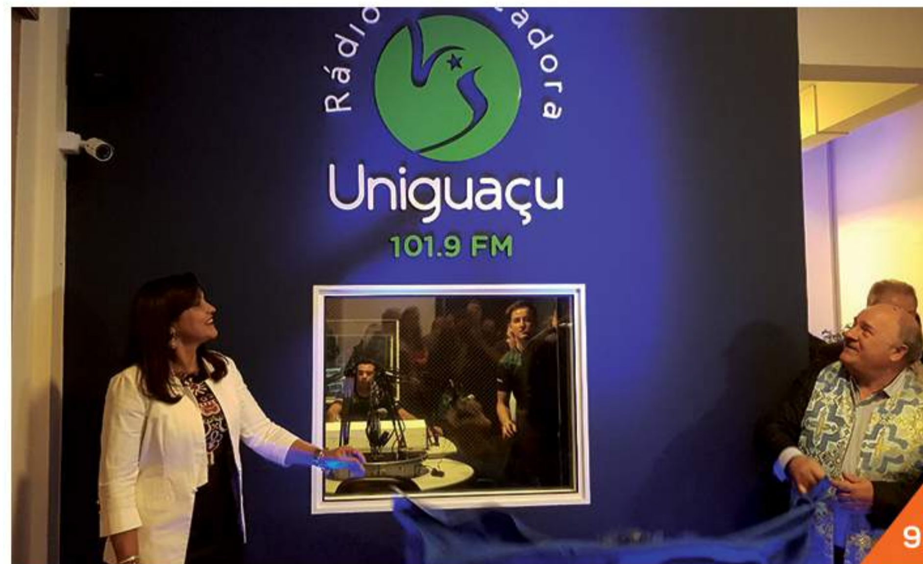
Rádio Educadora Uniguaçu estreia com nova programação